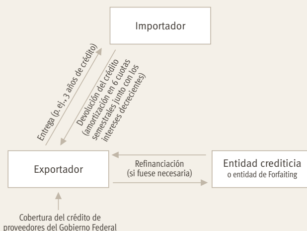
RELACIÓN CONTRACTUAL EN CASO DE UN CRÉDITO DE PROVEEDORES A MEDIO PLAZO

Las operaciones de exportación con fechas de pago del crédito a medio y largo plazo frecuentemente se financian con la participación de un banco a través de un CRÉDITO AL COMPRADOR . Su socio empresarial alemán normalmente lo podrá gestionar: ¡pídselo! La entidad de crédito alemana (aunque también ciertos bancos extranjeros, así como todas las sucursales alemanas de bancos extranjeros) le concederán a usted o a un banco en su país un préstamo, con el que paga, en el momento del suministro de la mercancía o del inicio de la prestación, el precio de compra que usted deba al exportador alemán. Entonces, se abonará inmediatamente el ba-